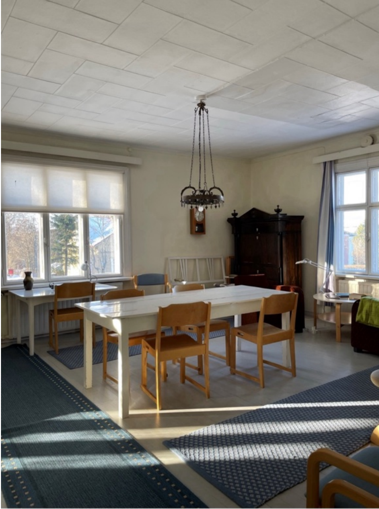
Villa Sarkian salonki talvivalossa vuonna 2023.

Vuonna 2023 Villa Sarkiassa asui 29 residenssivierasta 1–4 viikon jaksoissa. Asukkaista 8 oli kansainvälisiä vieraita ja 21 kotimaisia. Asukasviikkoja kertyi yhteensä 102,5.