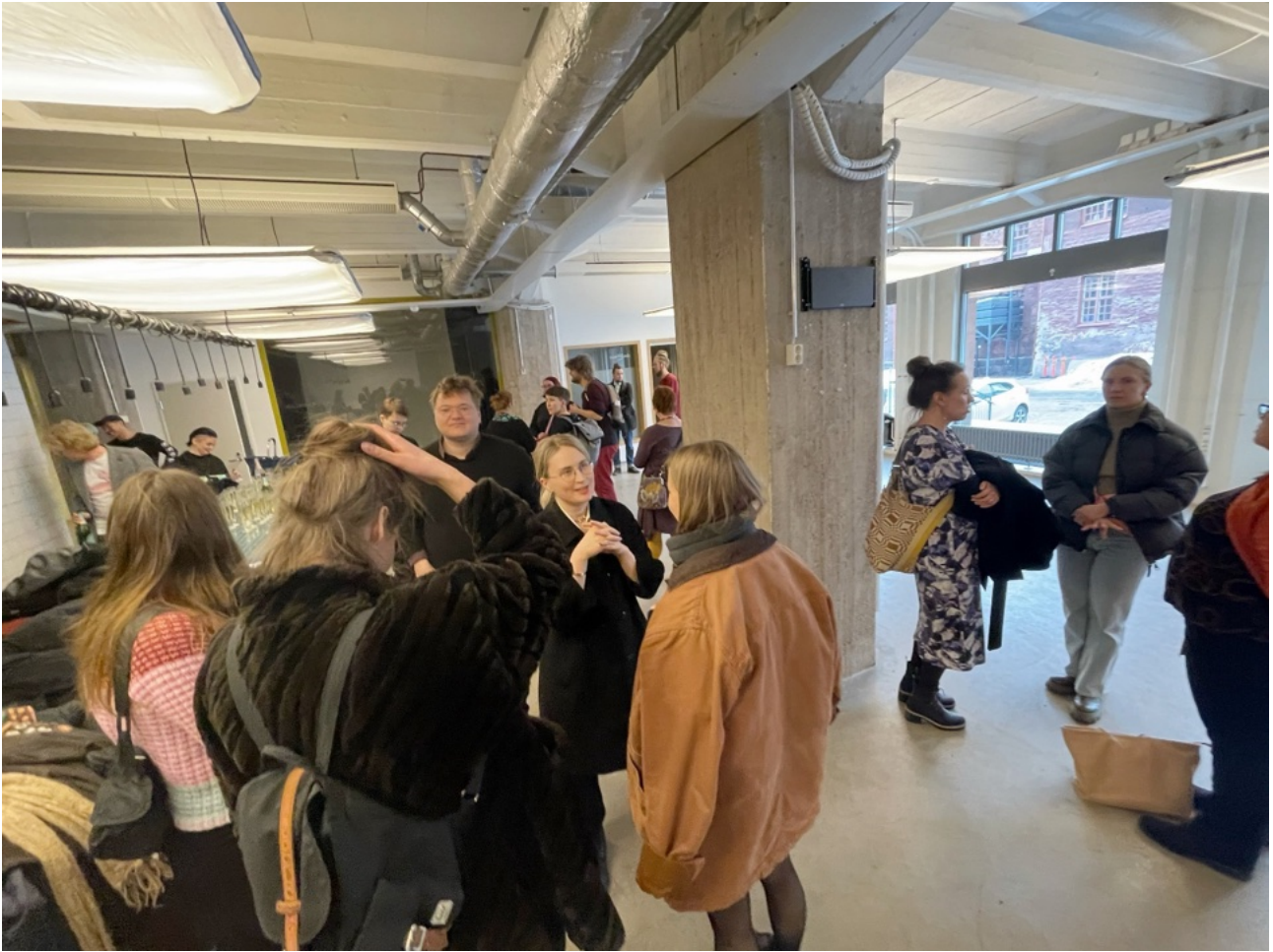
Maaliskuussa 2023 Tekstin talon tulevat toimijat pääsivät tutustumaan remonttityömaahan

Tekstin talo on kirjallisuusyhteisö ja kirjallisuustoimijoiden syksyllä 2024 perustama kulttuurikeskus Helsingin Sörnäisissä. Se on luova, houkutteleva keskittymä, joka elävöittää kaupunginosaa ja nostaa kirjallisuuden esiin sekä ruokkii kohtaamisia ja uusien ideoiden syntymistä. Tarjolla on monenlaista matalan kynnyksen toimintaa kaupunkilaisille.